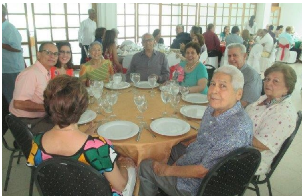
Mesa CN Rodríguez, CN Gómez, CN Gómez, CC Barraza y señoras y familiares