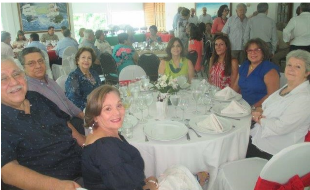
Mesa del CN Vargas y CR González Amadeo con señoras y amigos