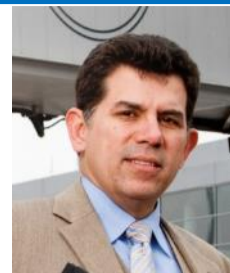
Editor / Corresponsal Europa