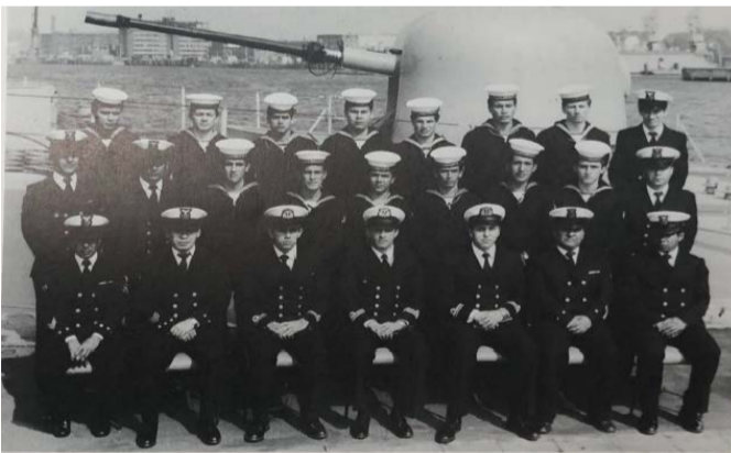
DEPARTAMENTO DE OPERACIONES