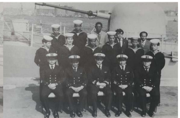
DEPARTAMENTO DE SERVICIOS