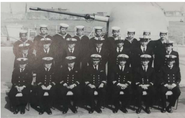
DEPARTAMENTO DE INGENIERIA