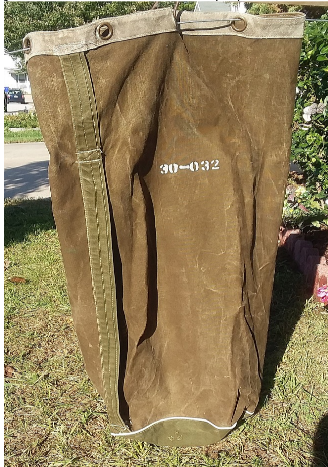
Jueves Agosto 1º, 1957 Escuela Naval (Tula) (Oct. 28, 2018)

Dos semanas más tarde, cuando no era parte de la guardia de turno entré al calabozo en el rancho del segundo piso después de la comida del viernes. Era un closet de unos 2x1 metros de piso de baldosín y con un hueco como ventana pequeña más arriba de la puerta, allí se almacenaban mapas, baldes y otros utensilios para la limpieza del edificio.