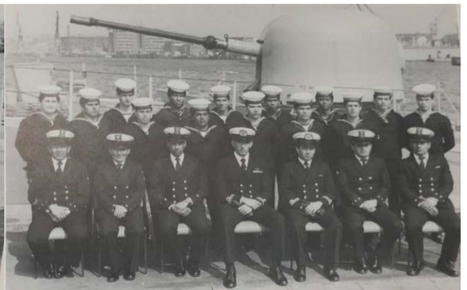
DEPARTAMENTO DE ARMAMENTO