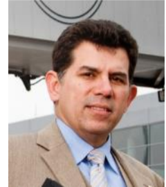
Editor / Corresponsal Europa