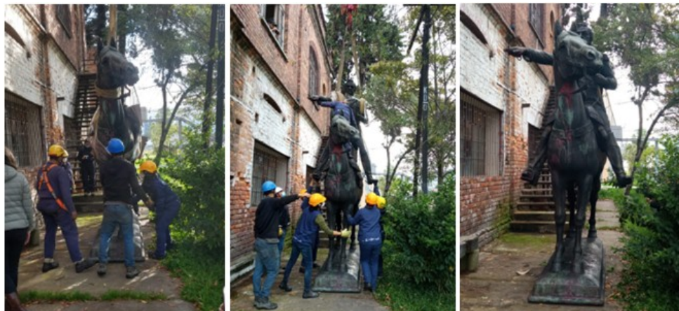
Imagen 3.- Registro fotográfico proceso de traslado e implantación temporal del "Bolívar Ecuestre para proceso de restauración"

En lo que respecta al denominado "Pedestal Monumental", las plataformas y escalinatas de acceso, donde reposaba la escultura referida, que como se precisó previamente no se encuentra incluida dentro de la declaratoria como bien de interés cultural, es una construcción que se verá afectada directamente por los requerimientos técnicos y operativos que dan paso al corredor del proyecto de la Primera Línea de Metro de Bogotá – PLMB - Tramo 1, permitiendo técnicamente la continuación hacia el norte del Tramo 2 de la PLMB.