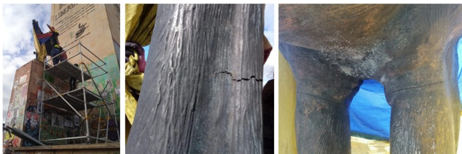
Imagen 1.- Registro fotográfico visita técnica adelantada donde se evidencian las afectaciones de la escultura.

En esta visita estuvo presente el equipo de arquitectos restauradores y restauradores de bienes muebles de la Subdirección de Protección e Intervención de esta entidad, junto con un equipo técnico del Instituto Distrital para la Gestión del Riesgo y Cambio Climático - IDIGER, durante la cual se identificó que debido a la exposición a fuerzas externas y quemaduras sobre el bien se vio afectada su estabilidad.