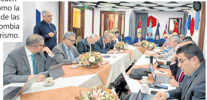
Reunión del GREI con el ex Ministro de Defensa; Juan Carlos Pinzón.