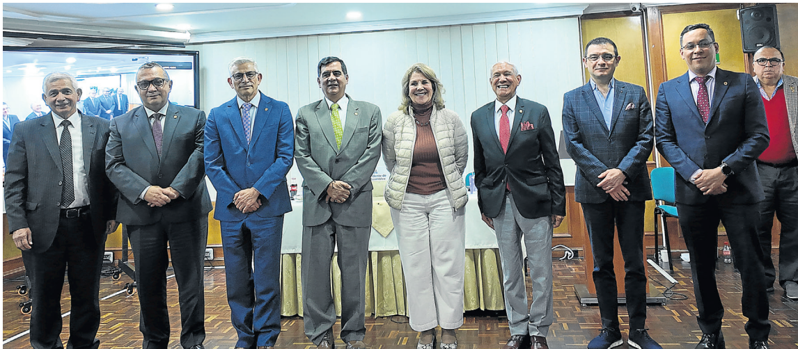
Ratificación de la elección del Presidente Nacional y de la Junta Directiva Nacional para el período estatutario 2026 - 2029 y toma de posesión.