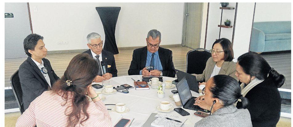
Reunión con la ONU sobre el fenómeno del mercenarismo.