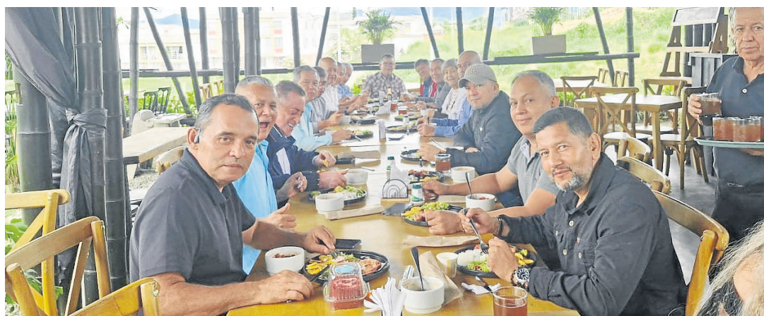
Celebración cumpleaños en Seccional Risaralda.