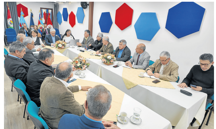
Asamblea General de CONFECORE en sede nacional.

Así mismo, participamos en encuentros de carácter internacional, como la reunión con el grupo de trabajo de las Naciones Unidas en visita a Colombia sobre el fenómeno del mercenarismo.