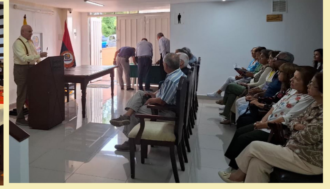
Asamblea General, Seccional Quindío.