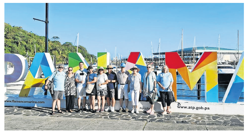
Seccional Valle, viaje de compañeros a Panamá.