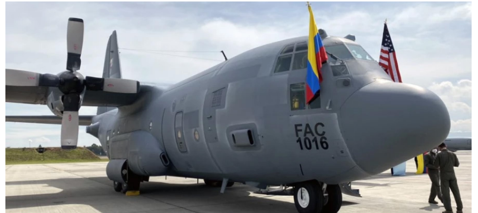
Hércules FAC 1016 donado por EEUU en enero de 2021 y accidentado en marzo de 2026.

La aeronave, de color blanco y gris, con el tricolor colombiano en su cola, transportaba a un grupo de 70 alférezes del arma de Infantería, quienes emprendíamos nuestra primera comisión colectiva en el exterior. Tras cerca de 12 horas de vuelo, incluyendo una escala en Fort