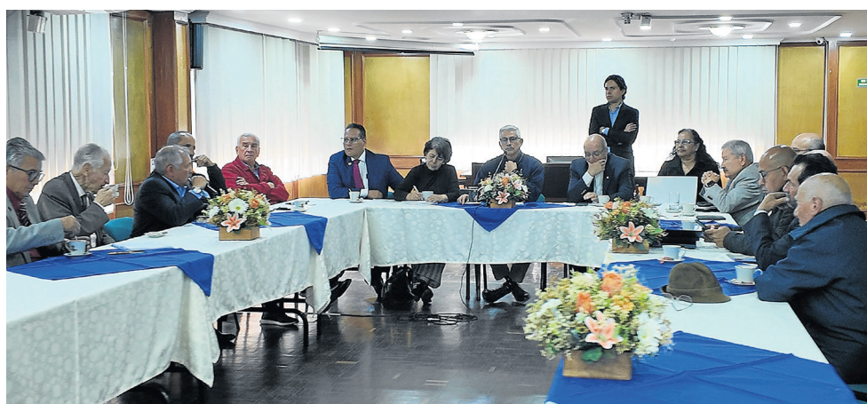
Reunión con la mesa de trabajo Fuerza Púrpura en sede nacional ACORE.