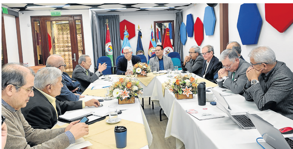
Reunión con el equipo de análisis JEP en sede nacional.