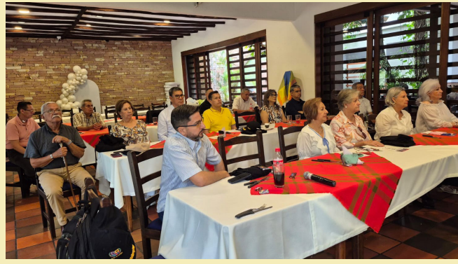
Asamblea General, Seccional Santander