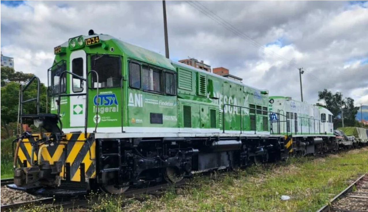
El Ferrocarril del Pacífico.