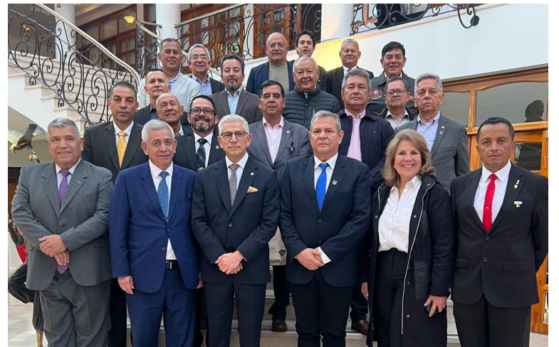
Presidentes de seccionales, junto a miembros de la Junta Directiva Nacional, en la jornada del taller para la construcción del Plan Estratégico 2026-2029.