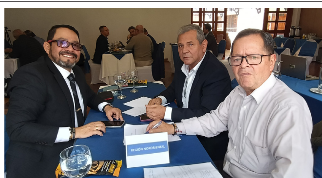
Presidentes y delegados de las Seccionales Norte de Santander, Santander y Boyacá

El 20 de marzo de 2026 se llevó a cabo la reunión de presidentes de seccionales de ACORE, en la que se desarrolló un taller estratégico enfocado en la construcción del Plan Estratégico 2026-2029. Este trabajo articulado permitió fortalecer la integración, la articulación y la alineación institucional entre las seccionales del país, consolidando una visión compartida para los próximos años.