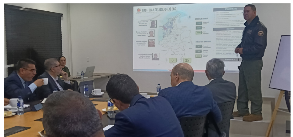
Reunión con el CCOET.