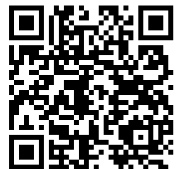
Video intervención, General (R) Guillermo León León, Presidente ACORE y CONFECORE en el Congreso de la República.

Porque al final, lo que está en juego no es solo la situación de los comparecientes, sino la credibilidad del Estado colombiano y la legitimidad de sus instituciones.