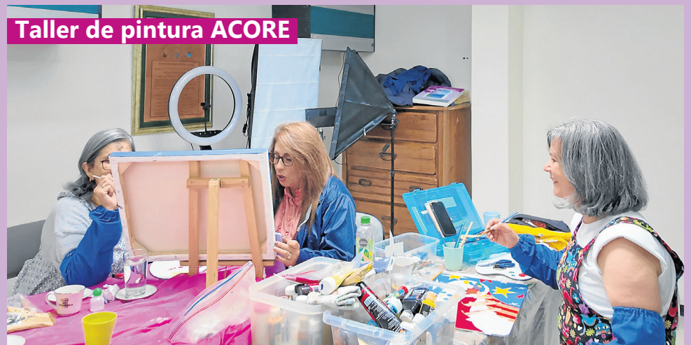
Taller de pintura ACORE