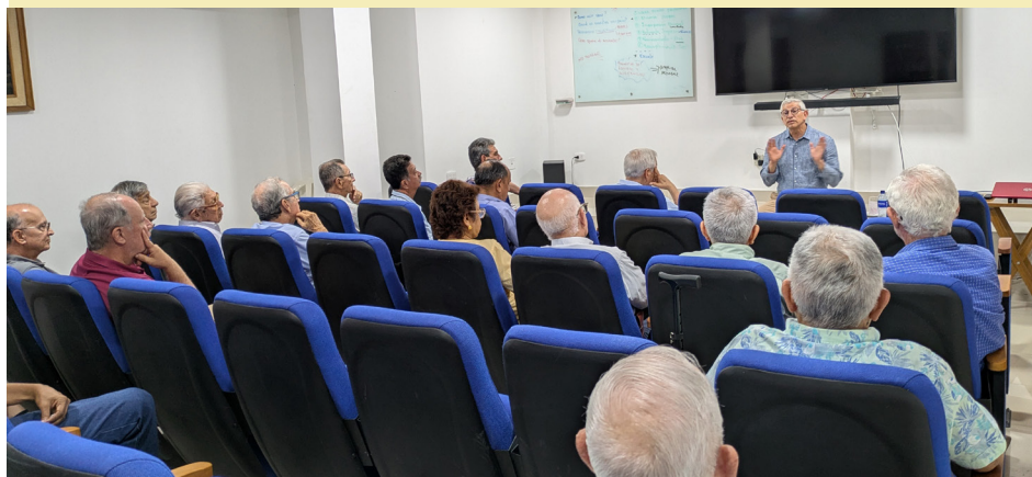
Asamblea en Seccional Bolívar.