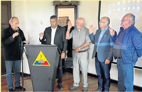
Posesión presidente Seccional Boyacá

Asambleas en las Seccionales: en cumplimiento de los estatutos se han desarrollado las elecciones y asambleas de nuestras seccionales.