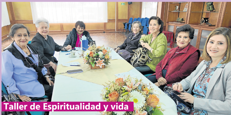
Taller de Espiritualidad y vida

Actividades desarrolladas en pro del bienestar y esparcimiento de nuestros asociados en sede nacional ACORE.