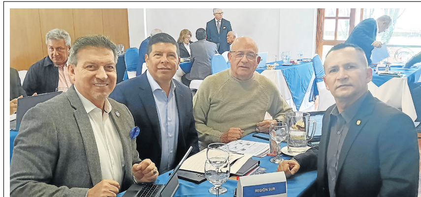
Presidentes y delegados de las Seccionales de Valle, Nariño y Cauca.