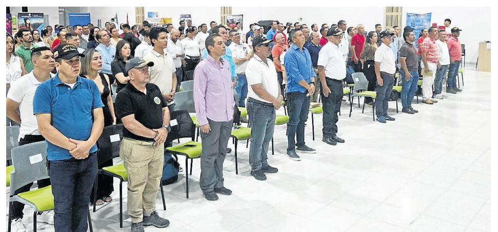
Expoveteranos, seccional Huila.